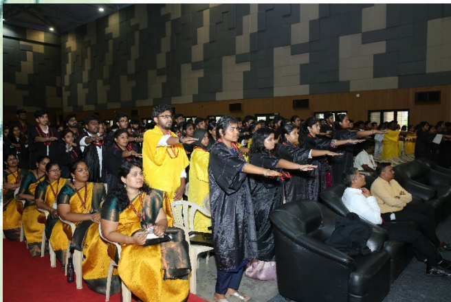
The New Graduates taking up their Graduation Day Pledge