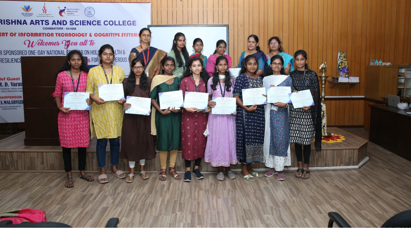
Participants and Paper Presenters of the Seminar with the Certificates